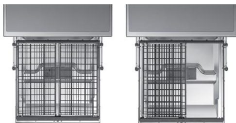
Szuflada na sztućce z przesuwanymi elementami