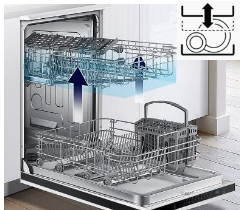
Łatwa regulacja wysokości górnego kosza