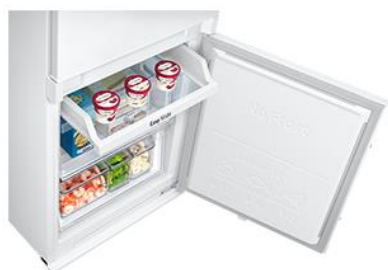
Półka Easy Slide